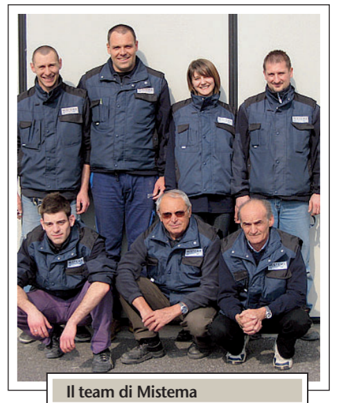
Il team di Mistema