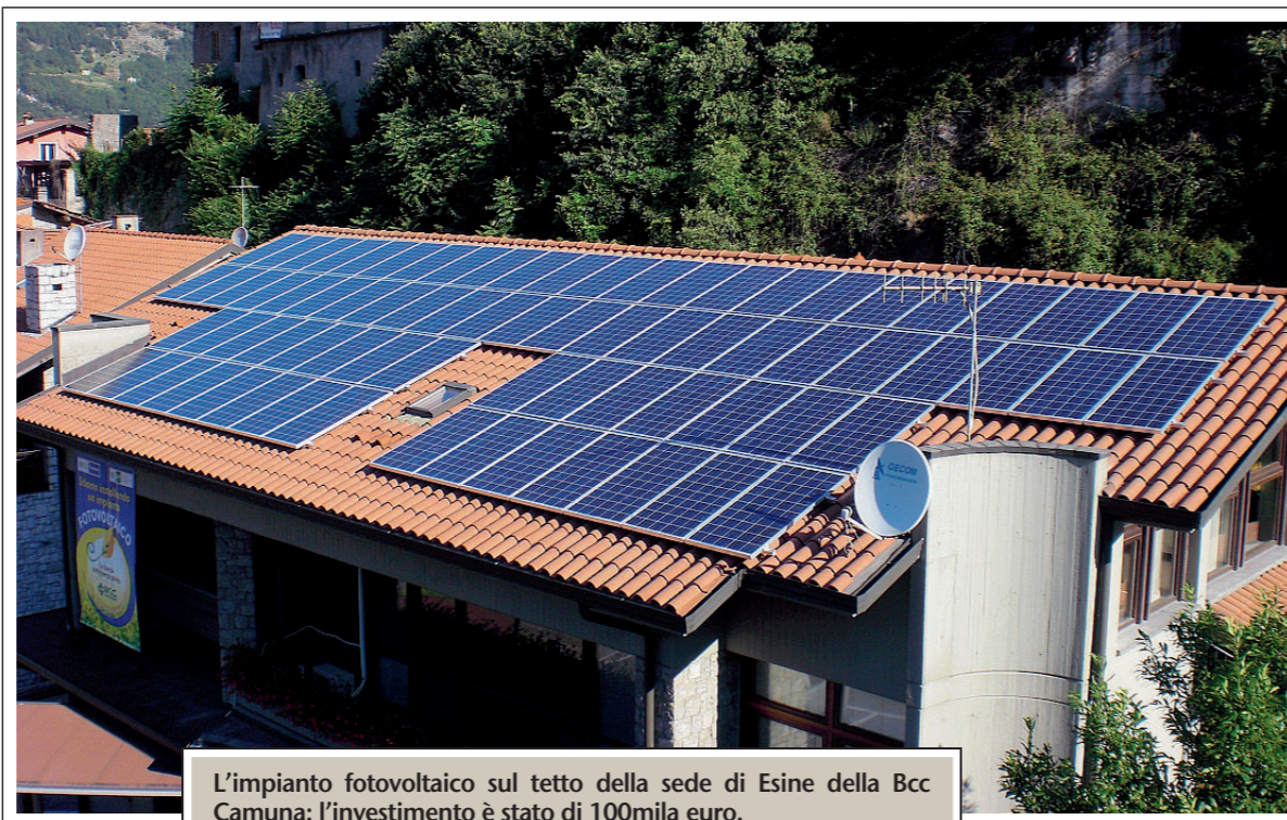
L'impianto fotovoltaico sul tetto della sede di Esine della Bcc Camuna: l'investimento è stato di 100mila euro.